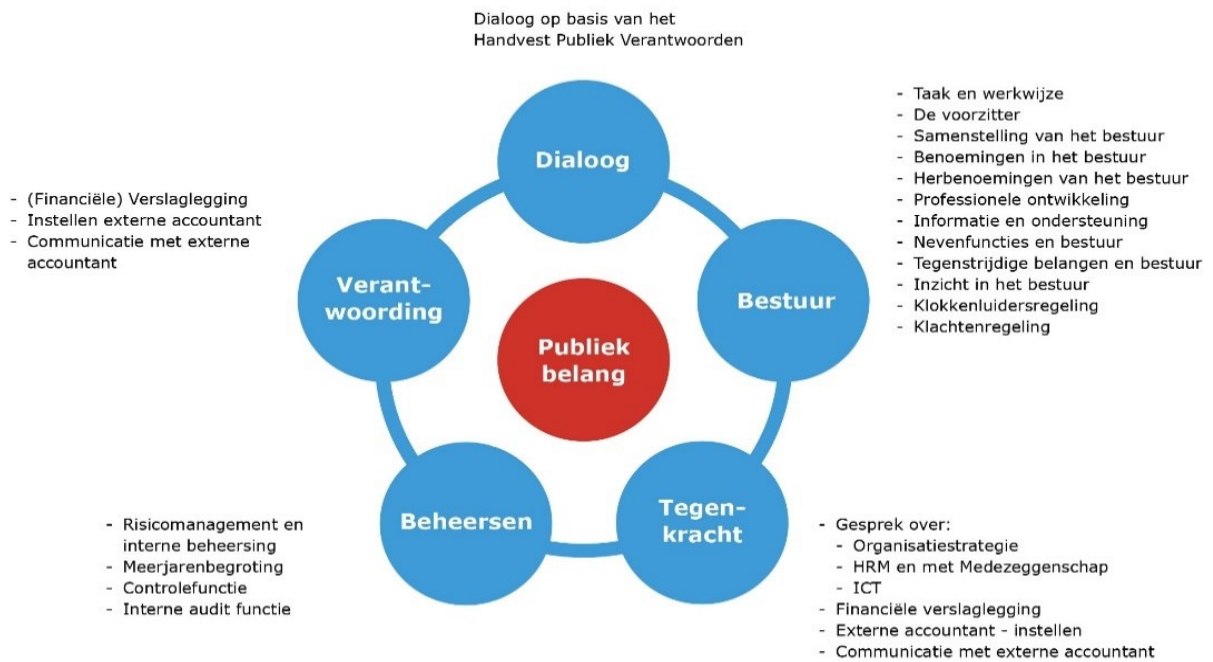
Figuur 3. Cirkel governance toets

onderdelen van de cirkel kan ook andere elementen negatief beïnvloeden. Een slechte communicatie versterkt bijvoorbeeld de negatieve energie van de tegenkrachten.