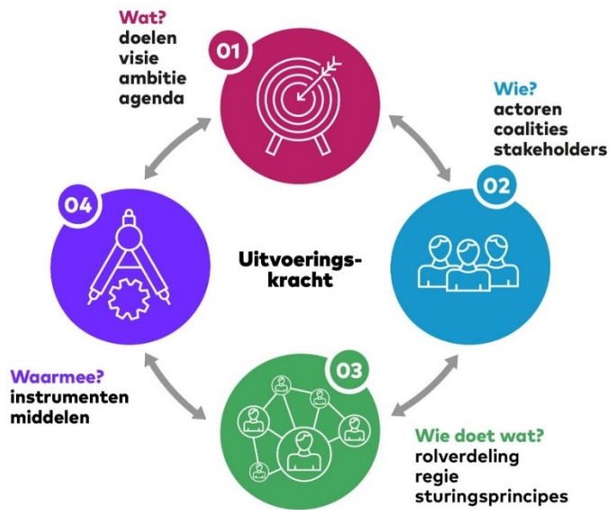
Figuur 2. 4 W model

beginfase stond, was het veelbelovend ten aanzien van een adequate invulling van het 4W model op landelijk niveau.