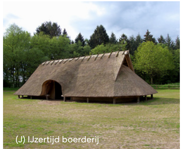
(J) IJzertijd boerderij