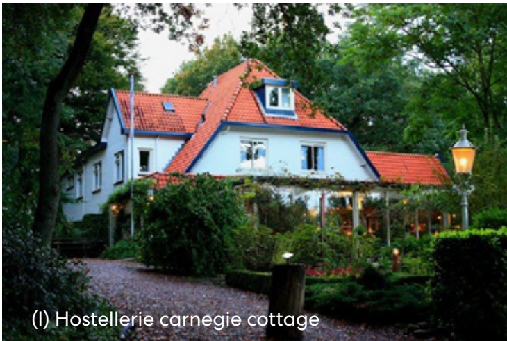
(I) Hostellerie carnegie cottage