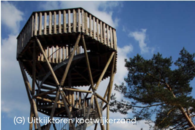
(G) Uitzijktoren kootwijkerzand