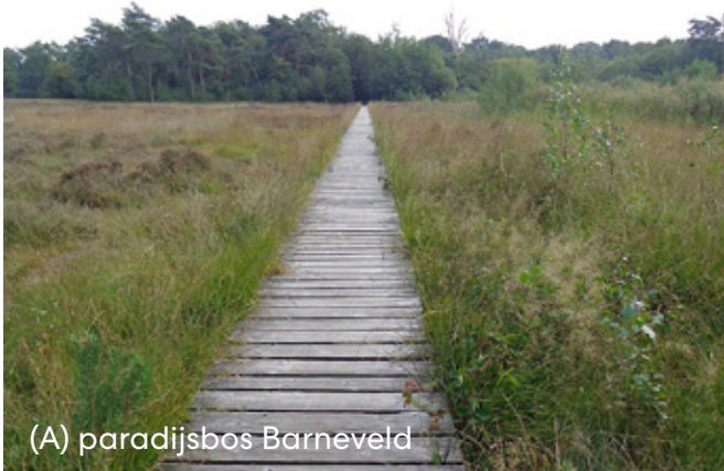
(A) paradijsbos Barneveld