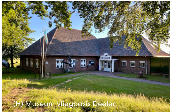
(H) Museum vliegbasis Deelen