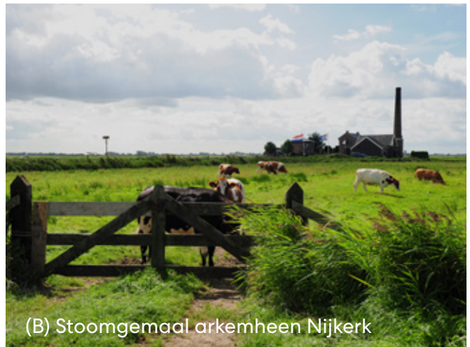
(B) Stoomgemaal arkemheen Nijkerk