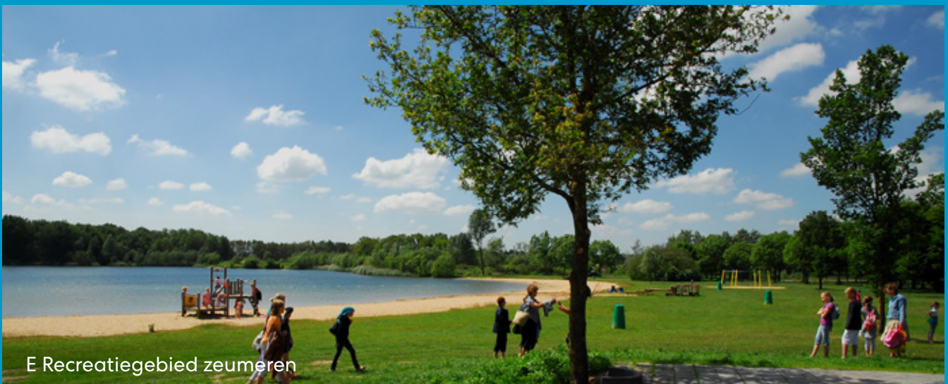
E Recreatiegebied zeumeren